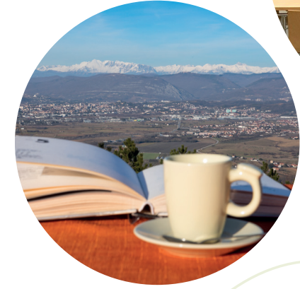
Dogodki z razgledom