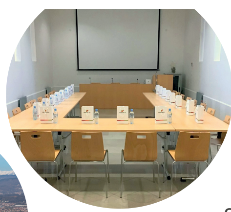
Sodobna konferenčna dvorana