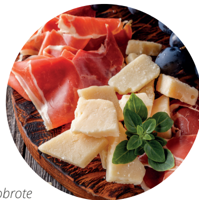
Lokalne dobrote v Okrepčevalnici Cerje

V Okrepčevalnici Cerje lahko organizirate aperitiv v družbi sirov, pršuta in špargljev, tople lokalne poslastice s sezonskimi sestavinami ali odmor s kavo in sladico. Dobrote so sočnejše ob vrhunskih kraških in vipavskih vinih.