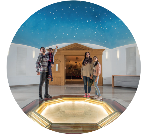
Brižinski spomeniki pod zvezdnim nebom